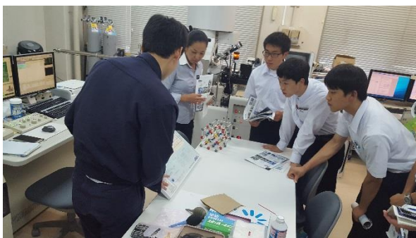
精密測定機器の説明