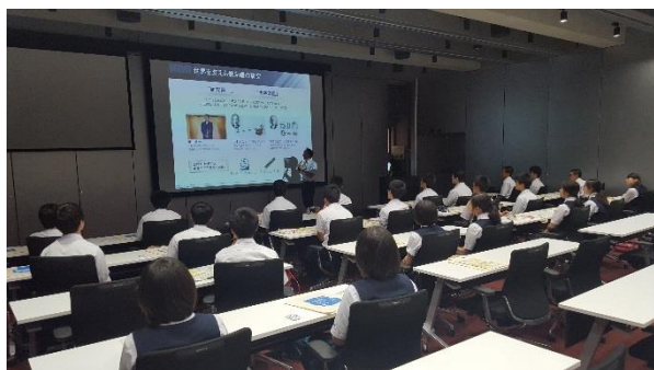
研究所の目的等についての全体説明