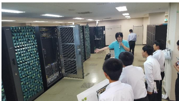
スーパーコンピューター見学